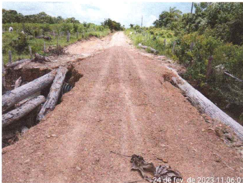
24 de fev. de 2023 11:06:01