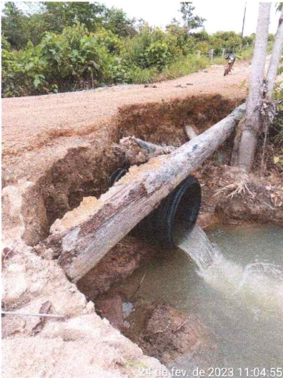
24 de fev. de 2023 11:04:55