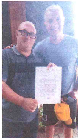
Com Deputado Estadual Faissal Calil em Cuiabá 20/02/2024